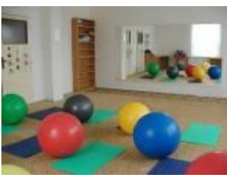
tělocvična Na Podlesí