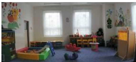
herna v prostorech Na Podlesí

Navíc jsme dokonce nuceni si na probíhající i plánované vzdělávací projekty pronajmout další místnost v Kadani (jako učebna nám slouží až do pololetí 2007 místnost v ulici Kpt. Jaroše 612).