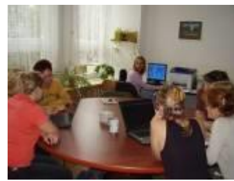
další víceúčelová místnost